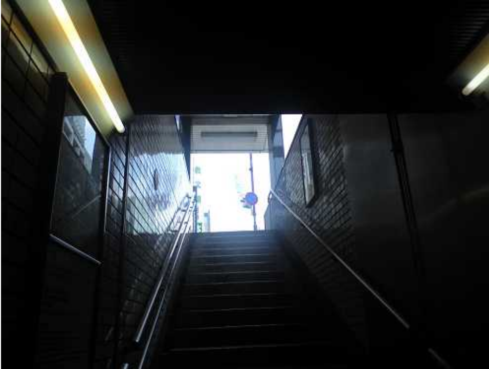
『東京メトロ銀座線出口階段・午前10時』