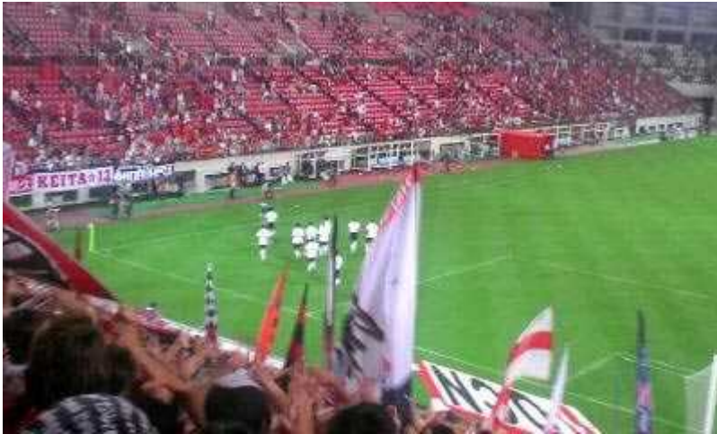
【さいたま CityCup】浦和 2-4 バイエルン 花試合だと考えれば、まあ楽しかった。