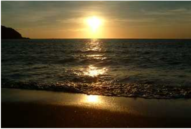
左手の岬に真っ赤な夕焼け。