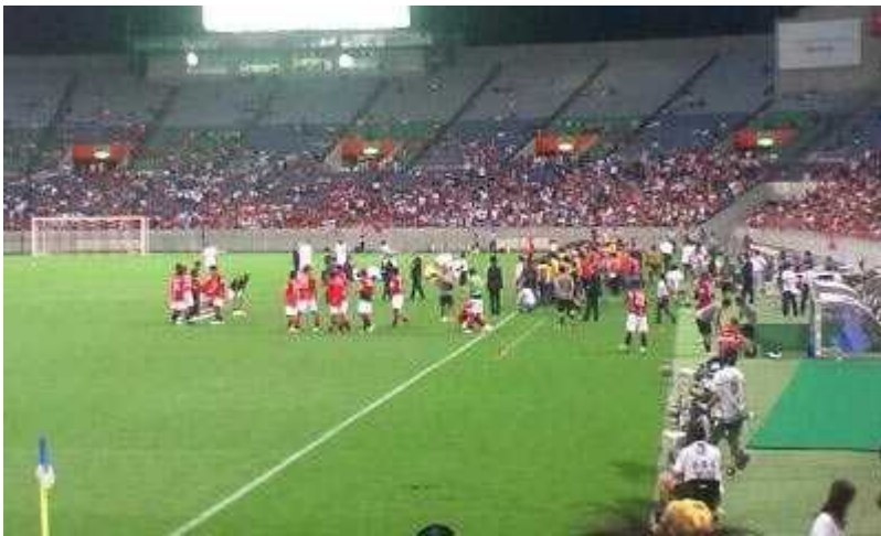
【J1 リーグ戦 第20節】浦和 2-2 柏 今日は取りこぼした。 次はきっちり勝つ。