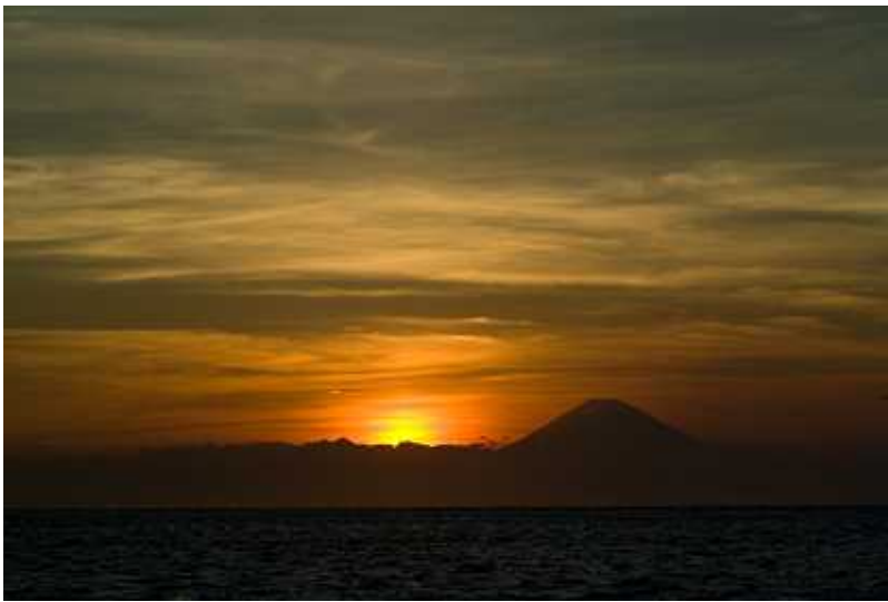
目の前の海に沈む太陽にシルエットとなった富士山。