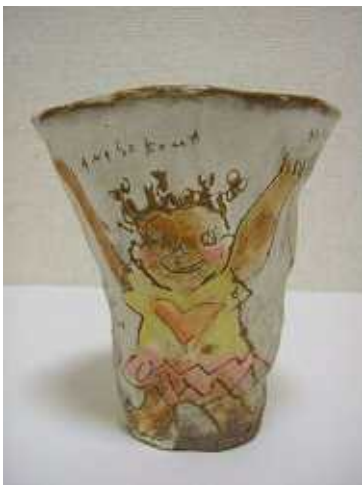
茨城県の笠間焼き

色をまるでサプリメントのように取り入れるカラーヒーリングの視点でいうと、こんなカ