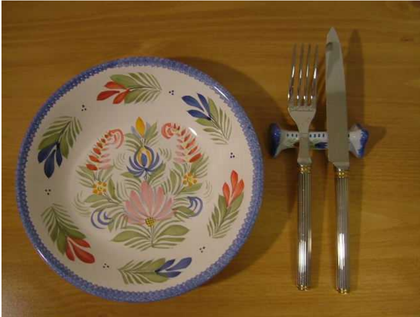
フランスのカンペール焼き