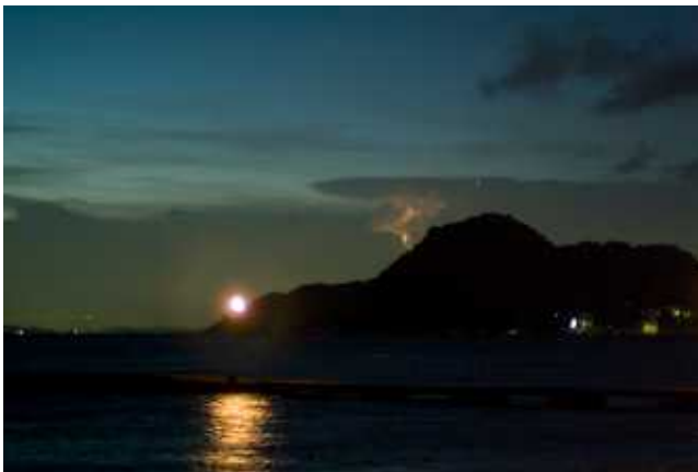
(C)太宰敏雄 右手は、真っ黒の積乱雲から雷が光輝く。