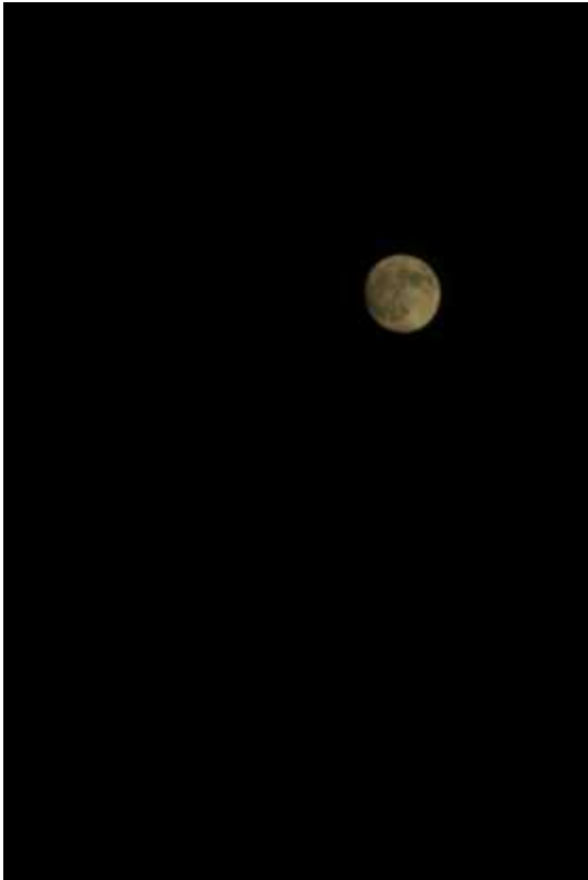
真後ろからは、満月が上がり始める。