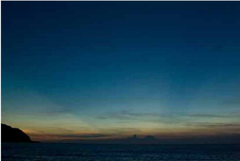
富士山から後光が差し、45度上昇に向かって二つのスジが現れる。