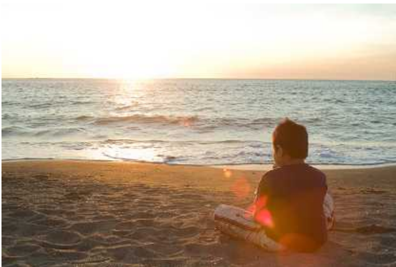
(C)太宰敏雄 夕日が沈む。